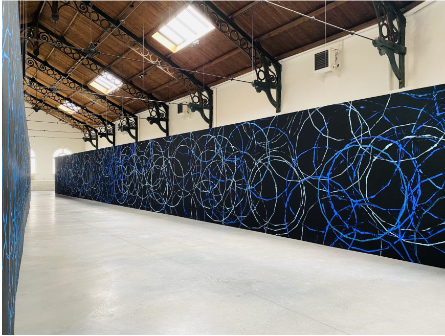
Alice Anderson « DANSES TECHNOLOGIQUES / GPS » 2021, acrylique sur toile, gouttes de pluie, 4000 x 300 cm